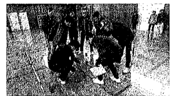
(井口地区体育振興会) 鈴が峰学区体育協会 井口台学区体育協会 井口学区体育協会

3月5日(日)鈴が峰小学校体育館で井口地区体育振興会主催の軽スポーツの振興を兼ねた大会が開催されました。種目は室内ベタンクです、Aグループ、Bグループで予選試合をして、順位決定戦の結果、優勝は、井口B、2位、井口A、3位、井口台A、鈴が峰Bは7位でした。皆さんお疲れ様でした。(体協 広兼)